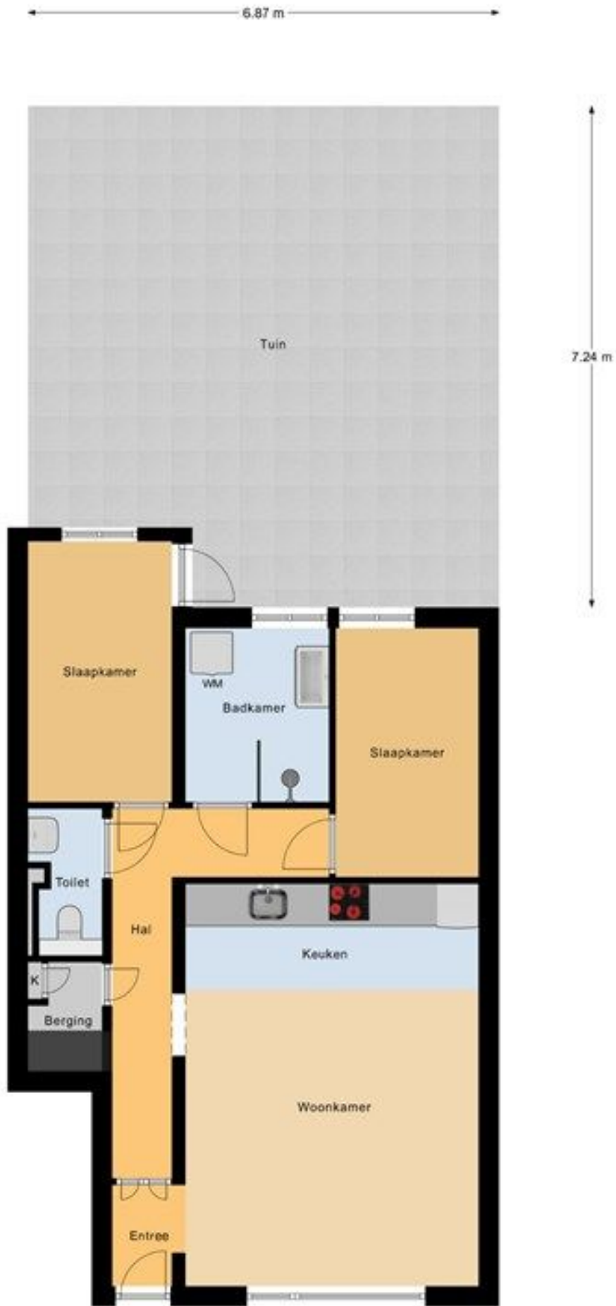
Begane Grond Tuin